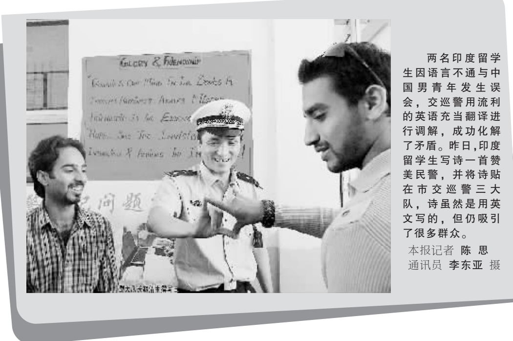
两名印度留学生因语言不通与中国男青年发生误会,交巡警用流利的英语充当翻译进行调解,成功化解了矛盾。昨日,印度留学生写诗一首赞美民警,并将诗贴在市交巡警三大队,诗虽然是用英文写的,但仍吸引了很多群众。

民警搜出的一份账单显示,该窝点一次就向南方贩运了野生麻雀、斑鸠2万多只,总收购价值2万多元。郑州森林公安分局郑州果树研究所公安派出所所长王正介绍,仅将这些野生鸟类贩卖到南方城市,犯罪分子就可从中获取300%~400%的利润,正是暴利促使一些村民铤而走险,逐步形成了捕捉、收购、转运、贩卖的“一条龙”犯罪网络。郑州森林警方将进一步加大打击力度,彻底斩断这个非法贩卖野生鸟类的通道。