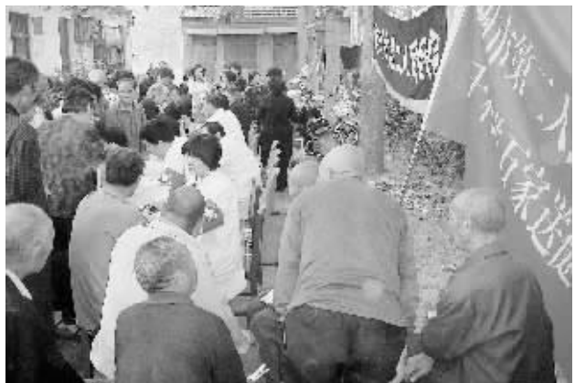
郑州市第二人民医院“健康快车”自2001年启动以来,巡回义诊近百次,为两万余人次赠药、体检。