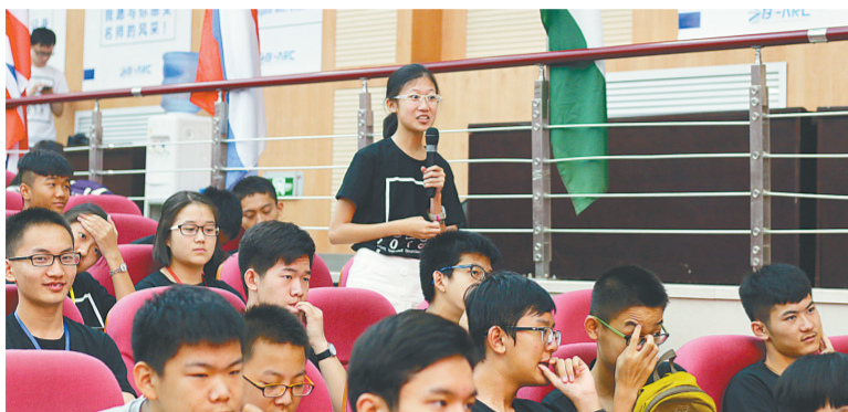
百名学子认真聆听

“年轻的朋友们,你们是否想过,你是谁?你的心里装着谁?你的未来会走向哪里?你的根在哪里?……”昨日,在郑州外国语学校开幕的第二届中美精英大学体验营开幕式上,央视“名嘴”张泽群回到家乡,现场为来自全省的“学霸”们捧出了一道丰厚的心灵“大餐”。