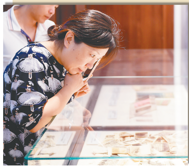
9月3日,由中国人民抗日战争纪念馆筹备的“社会各界捐赠抗战文物”专题展在北京开幕,展览共展出各类抗战文物史料及书画作品500余件(套)。截至7月7日,纪念馆共接受社会各界人士捐赠的文物史料及书画作品3673件(套)。

活,却借由年金改革,挑起族群冲突,只会导致台湾向下沉沦。 大游行在下午1时登场,参与民众在多个地点集合后,分四路向凯达格兰大道集结,最后在正对台当局领导人办公场所的主场地会合。 此次大游行是民进党当局上台以来岛内爆发的第一次大规模街头抗议活动,而此前岛内民航工作人员、游览车业者和南部农渔民等,皆因生计等问题发起过抗争。对此,岛内专家学者指出,这一方面表明越来越多的民众看清了民进党借“民粹”拼选举的本质,另一方面也暴露出当局领导人并不是一个会解决问题的领导者。