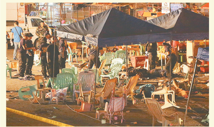
菲律宾总统杜特尔特家乡达沃一处街边市场2日晚遭遇爆炸袭击,致使至少14人丧生,71人受伤。事发当时,杜特尔特恰巧在这座城市内。达沃市长3日证实,爆炸的幕后黑手是反政府的阿布沙耶夫武装。