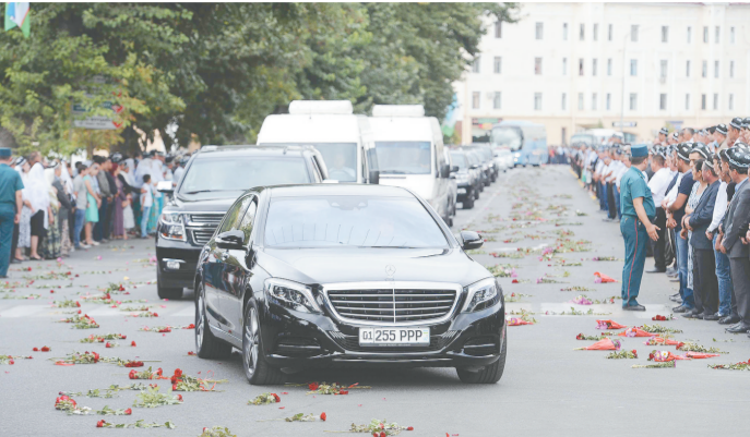
9月3日,在乌兹别克斯坦撒马尔罕市,人们自发走上街头,目送载有已故总统卡里莫夫灵柩的汽车通过。当天,卡里莫夫的国葬仪式在其家乡撒马尔罕举行。

当地时间9月2日晚,乌兹别克斯坦议会和政府宣布总统卡里莫夫因脑溢血救治无效于当天去世。卡里莫夫享年78岁。 中国国家主席习近平与国务院总理李克强3日就卡里莫夫逝世分别向乌最高会议议长米尔济约耶夫和乌总理米尔济约耶夫致唁电。两封唁电均指出,卡里莫夫总统是乌兹别克斯坦共和国的缔造者,他的不幸逝世,不仅是乌兹别克斯坦人民的巨大损失,也使中国人民失去了一位真诚的朋友。 应乌兹别克斯坦方面邀请,中国国家主席习近平特使、国务院副总理张高丽出席卡里莫夫总统葬礼。 乌兹别克斯坦电视台播放乌议会和政府声明说,卡里莫夫是真正的历史伟人。 卡里莫夫1938年1月30日出生,经济学博士。1990年当选为乌兹别克斯坦社会主义共和国总统。1991年8月31日,乌兹别克斯坦共和国宣布独立。同年12月30日,卡里莫夫当选为独立后的乌兹别克斯坦共和国首任总统。1995年3月,乌兹别克斯坦全民公决决定延长他的任期至2000年。2000年1月,他以91.9%的得票率再次当选为总统。2007年12月,卡里莫夫在新一届总统选举中再次连任。2015年3月他第四次当选总统。 卡里莫夫曾多次访华,并于2001年、2006年和2012年来华出席上海合作组织峰会,2008年来华出席北京奥运会开幕式,2014年来华出席亚信峰会,2015年9月来华出席中国人民抗日战争暨世界反法西斯战争胜利70周年纪念活动。