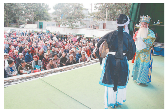
为满足群众实际精神文化需求,荥阳市委宣传部、文广新局组织百余场戏曲走进乡村街道。10月8日,荥阳市豫剧团“戏曲大篷车”来到京城办李村文化大院,为现场1000多位老人送来节日的问候和祝福。

与此同时,巩义市竹林镇举办金秋孝老敬亲暨红叶节活动。当天,来自全镇的50多位80岁以上老人齐聚长寿山景区孝拜广场看大戏、坐花轿,接受子孙的现场孝拜,接受晚辈们的祝福。此外,该镇还举办了“竹林九九重阳,百寿长寿寿宴”活动,该镇100位80岁以上老人及其家属齐聚长寿山,欣赏了三皇赐福、金猴拜寿、戏曲选段、喜庆歌曲等精彩节目,共同欢度重阳佳节。