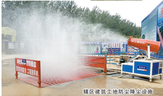
辖区建筑工地防尘降尘设施