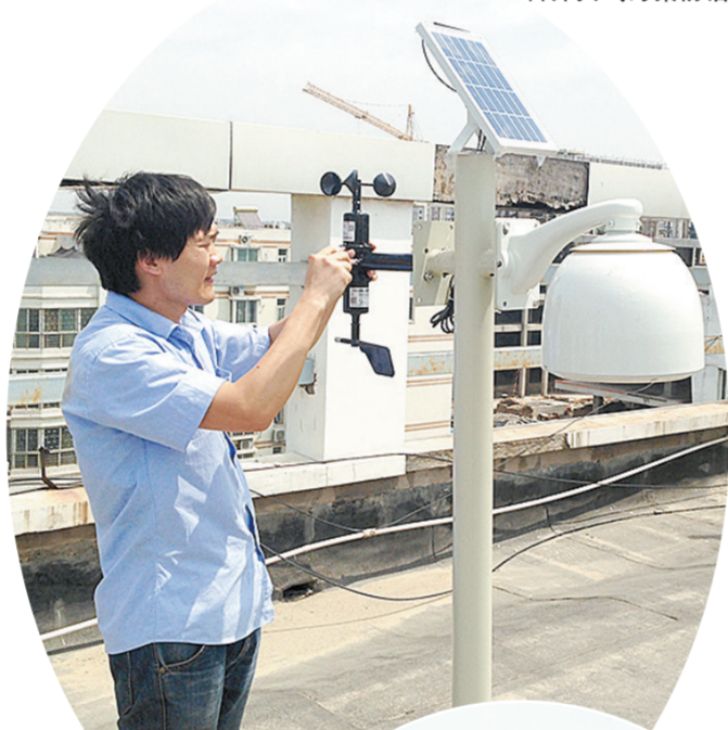
安装空气自动在线监测