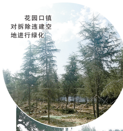
花园口镇对拆除违建空地进行绿化