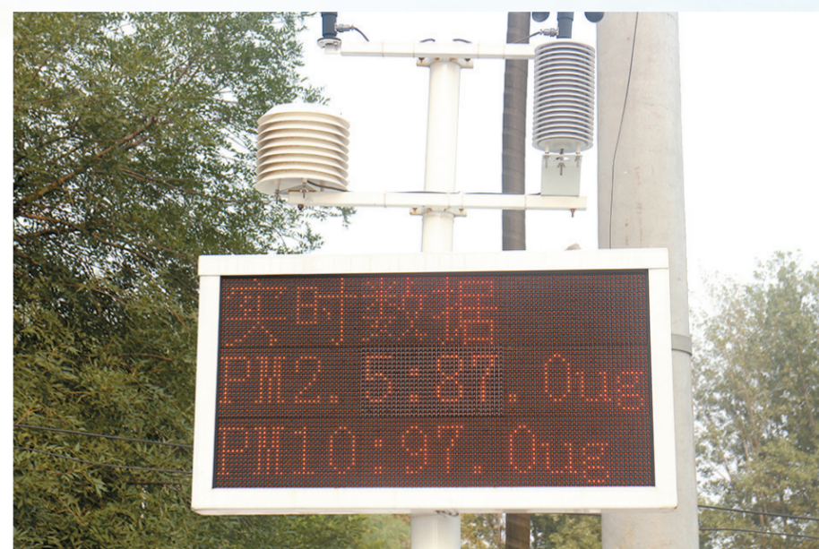
工地内安装的实时空气质量监测系统