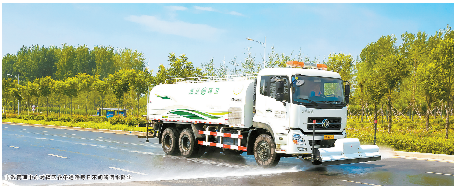
市政管理中心对辖区各条道路每日不间断洒水降尘

大气污染防治是一项长期工作,也是一项全民行动,是保护共同蓝天的必要工作。防霾治污,推动生态文明建设,倡导节能减排,培养全民环保意识,惠济区一直在努力。