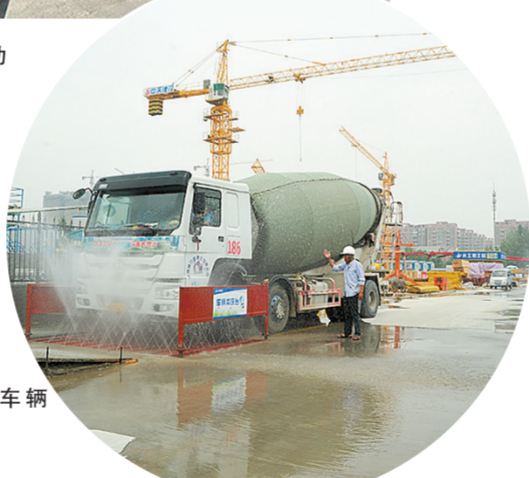
建筑工地车辆冲洗设备