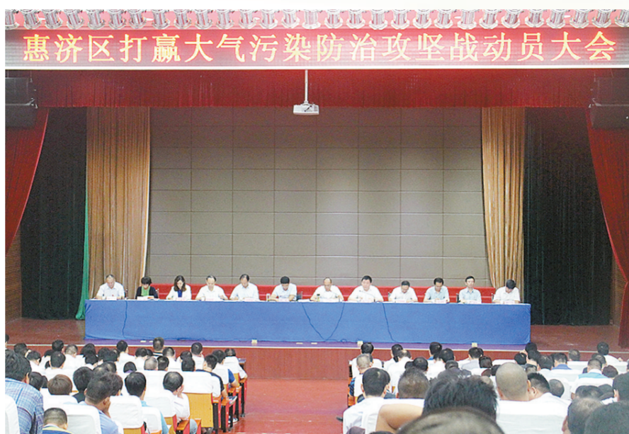
召开大气污染防治攻坚战动员会

新型城镇化建设办公室自大气污染防治攻坚战以来,加大对2个拆迁工地和13个待建工地扬尘治理综合力度,每天不间断对拆迁工地督查,及时了解工地动态,对存在扬尘问题的待建工地拍照取证,下达督办单,要求2天内整改落实到位,并每天上报落实情况。区市政管理中心按照区政府统一部署,对辖区道路进行全时段清扫保洁,加大对施工(拆迁)工地出入口附近道路的砂灰、污泥、垃圾等的清理工作,对全区道路实行全天候清扫保洁,将机械清扫与人工保洁紧密结合,针对不同道路采取不同的作业方式,每天24小时不间断洒水、喷雾作业,有效提高了道路清扫保洁效果。