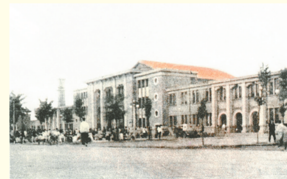
上世纪五十年代的火车站候车楼