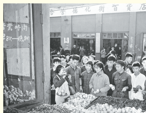
市民在德化街水果店买水果