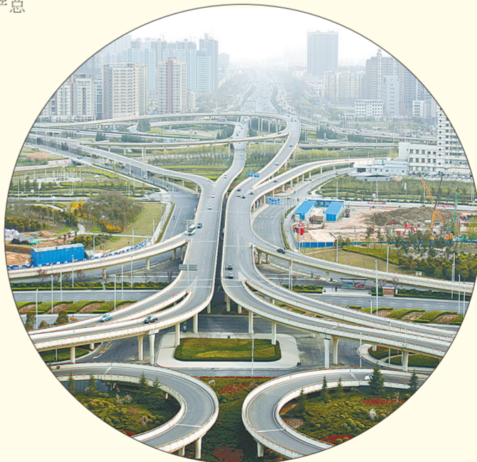
立交飞架，出行更加方便快捷

明显，成为全国拥有商品口岸最多的内陆城市，跨境电子商务和郑欧班列的运行机制、经营规模保持全国先进水平。在中国社会科学院的全中国城市综合竞争力排名中居第17位。郑州在国家发展全局中的战略地位日益突出，也因有如此坚实的“臂膀”与“后盾”，郑州迈向国家中心城市底气十足！