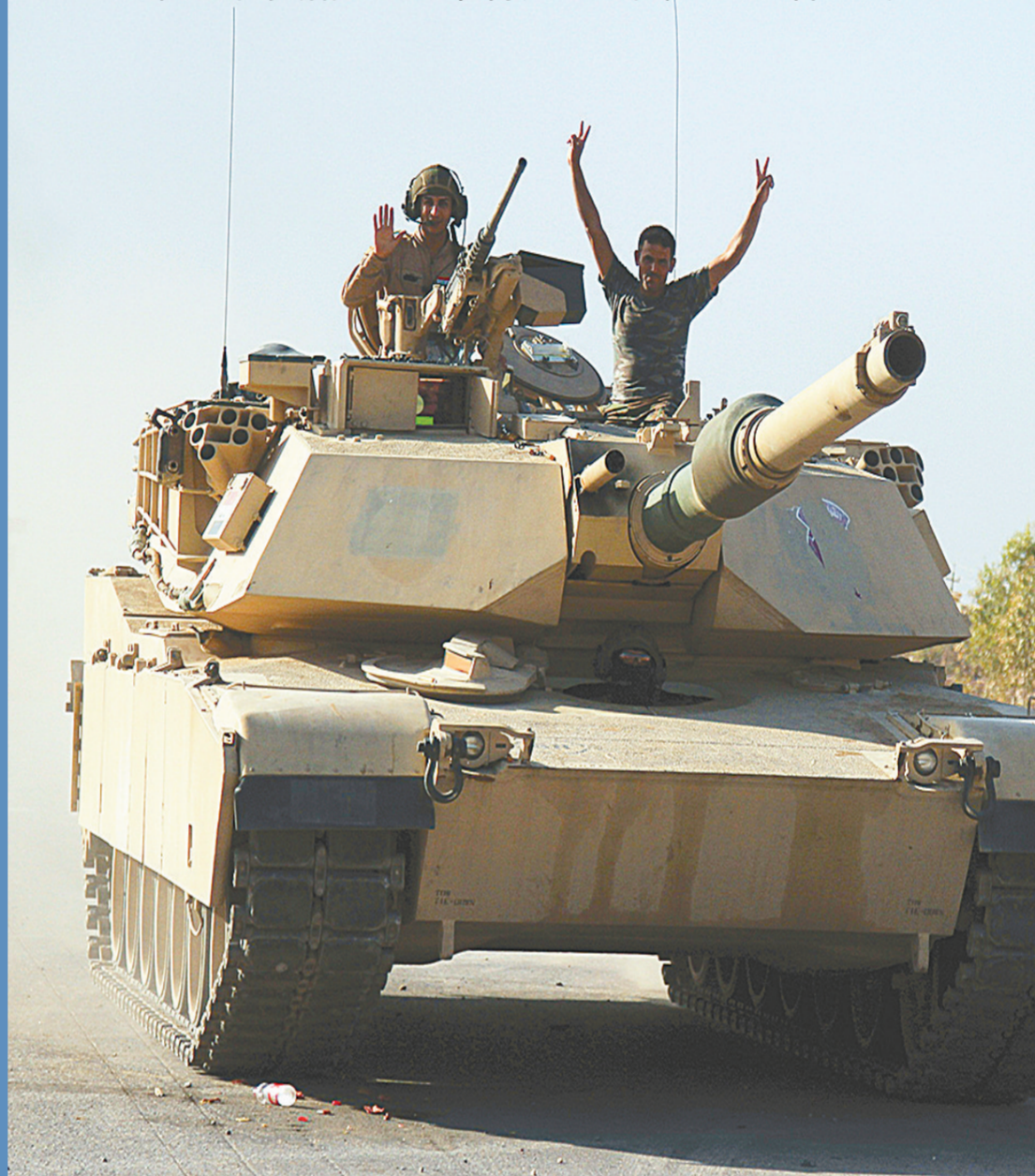
10月22日，伊拉克政府军士兵进入伊拉克摩苏尔东部约20公里的巴特拉村。

伊拉克政府军收复摩苏尔战役进入第六天，政府军22日击退“伊斯兰国”武装分子后完全收复了巴特拉村。截至22日已经收复20多个村庄。伊拉克总理阿巴迪近日说，摩苏尔战役初期进展顺利，超出预期。