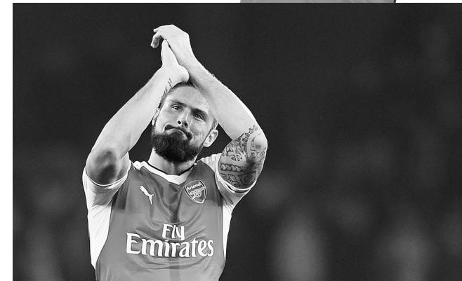
上图:利物浦队斯图里奇庆祝进球 下图:阿森纳队吉鲁向球迷致意