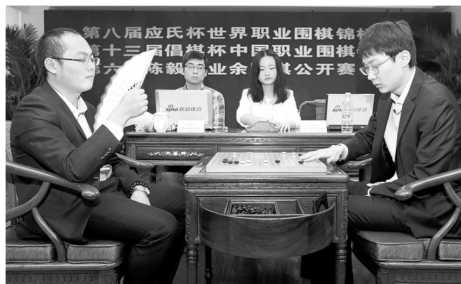
10月26日,中国棋手唐韦星(左)和韩国棋手朴廷桓在比赛中。当日,在第八届应氏杯世界职业围棋锦标赛五番棋决赛第五局比赛中,中国棋手唐韦星击败韩国棋手朴廷桓,以总比分3:2夺得冠军。