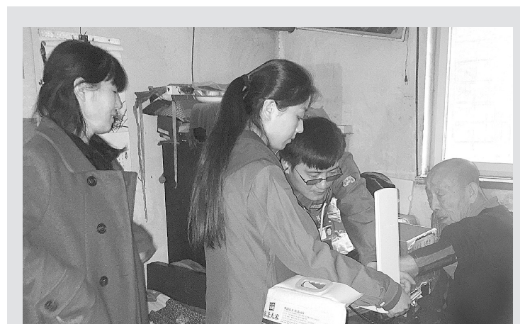
日前,中原区三官庙街道办事处爱心志愿者开展了以“帮扶帮困,爱心助老”为主题的走访慰问、义诊活动。

微信群的菜单还在无限量链接。现在还陆续建立了好爸爸好妈妈群、养生艾灸群、志愿者群、社区古筝舞蹈群等多个兴趣群,居民群众可以根据自己的喜好加入不同的微信群。通过不同的微信群,织成了一个快捷民情网,真正实现了社区与居民、居民与居民之间的“零距离”沟通。