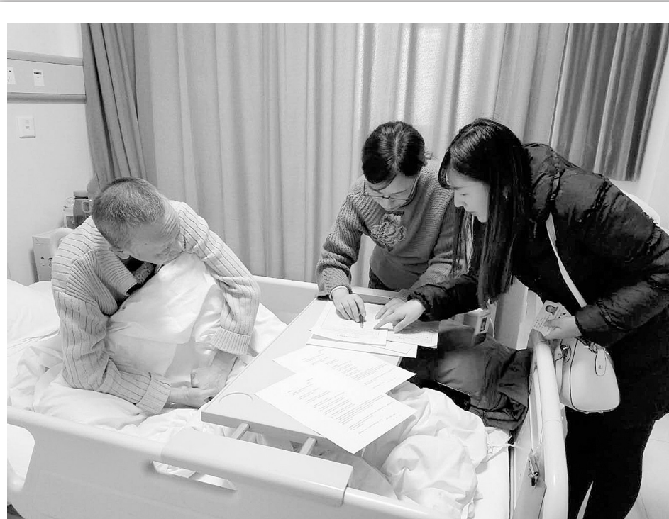
为满足特殊群众的业务办理需求,近日,郑州市不动产登记中心二七分中心为老、弱、病、残、孕等行动不便群众主动提供上门服务。