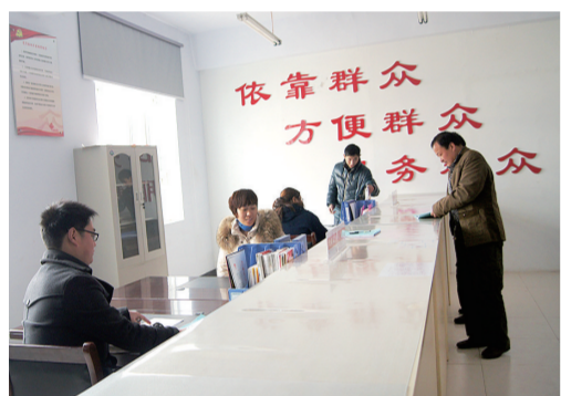
唐垌村便民服务站

该镇党委高度重视村支部书记队伍建设，采取“坐下来”学、“走出去”看、“请进来”讲等方式加强培训。从荥阳市委党校请老师对支部书记进行专题培训，对全镇43个村支书记