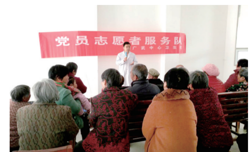
广武镇党员志愿者服务队为村民普及医学知识

的影响下，各村党支部纷纷引导成立符合本村特色的农业合作社，使分散的种植朝着集约化、规模化的方向发展，为农民增收致富探索了一条有效途径。