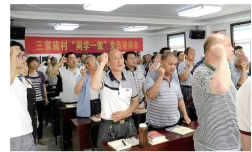
三官庙村“两学一做”党员培训会