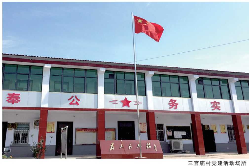
三官庙村党建活动场所

行轮训。组织党员前往红旗渠红色教育基地、焦裕禄纪念馆等地接受红色教育，组织村支部书记到优秀乡镇参观现代农业、新兴产业、新农村建设等成果，通过外出学习使他们开阔眼界、增长见识、开启思路。同时，请优秀书记现身说法，用身边人、身边事教育引导全镇支部书记。通过培训，支部书记的理论素养和引领群众致富的能力不断提高，普通党员的先锋模范作用不断加强。