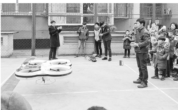
科普课堂上进行无人机试飞展示

把科普课堂搬到图书馆外面去。中原区图书馆以新颖的形式、精彩的科普内容吸引着小朋友们。这次举办的无人机科普课，是实施《全民科学素质行动计划纲要》，推广科技教育典型案例和科技活动的经验，提升未成年人科学教育理念的一部分。他们邀请郑州法学院无人机教育中心的老师为孩子们上了一堂“无人机科学技术知识讲座”，并现场进行无人机飞行表演。讲座中，老师为大家展示了不同的无人机种类，试飞体验也让孩子们感受到科普课堂的无限乐趣。