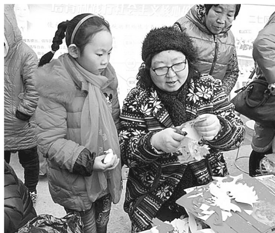
剪出漂亮的图案送给孩子

据悉，多年来，二七区逐渐将“三下乡”活动常态化，把“三下乡”变为“常下乡”，变“送文化”为“种文化”，不断联系“三农”、服务“三农”，活动内容日益丰富，方法手段不断创新，取得了很好的成效，成为深受农村群众欢迎的民心工程。