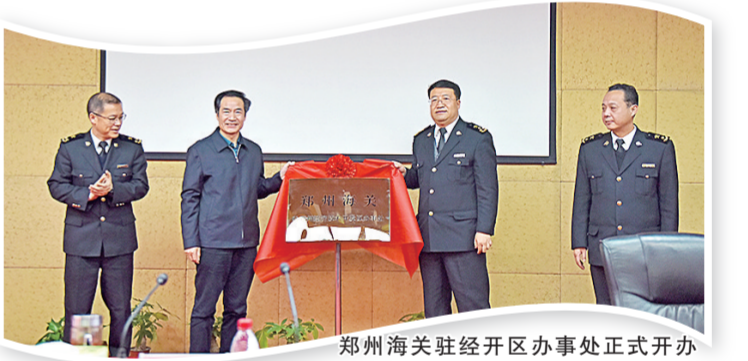
郑州海关驻经开区办事处正式开办

于郑州又多个“小境外”，只要有原材料和产品的进出口，就可以享受免税或退税政策，同时还能享受最大通关便利化政策，通关时间大幅降低。买卖全球，一站搞定。郑州经开综保区“境内关外”可开展进口商品保税展示，这对普通市民来说，在家门口“海淘”梦想成真，来自法国的红酒、德国的黑啤、澳大利亚的奶粉、韩国化妆品……市民都可在园区内一站式购买。降低成本、提速发展，政策“惠企”看得见。据了解，目前，所有开展进出口业务的企业都可入驻综保区内。入区企业可享受境外货物入区保税、境内货物入区退税、区内企业免征增值税、进口自用设备及维修零部件免税、水