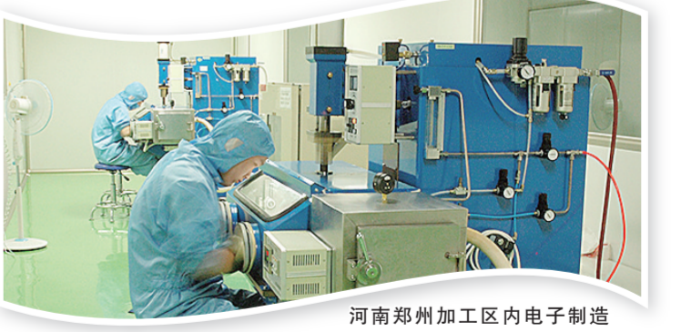
河南郑州加工区内电子制造

管、仓储、分拣、展示、交易、线下体验等业务能力，尽快实现跨境电商业务量日均百万包常态化目标。天不压高凌云志，路在脚下；海不厌深豪情发，雄图如画。站上新起点，郑州经开综保区将继往开来、奋发有为，撸起袖子干出繁花似锦的未来！