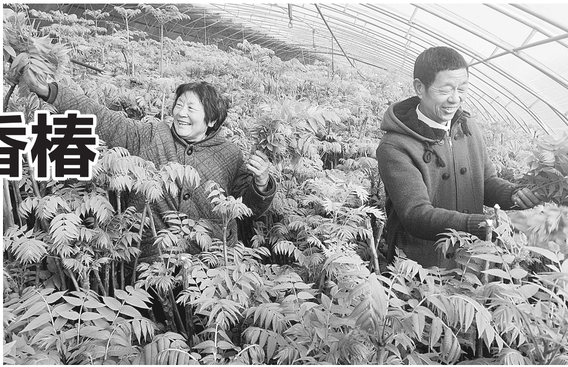
香椿丰收,种植户满面笑容

种植、小打小闹、恶性竞争的弊端,借助互联网,种植农户不出家门,不仅能把自家的香椿芽卖到省城郑州,还远销北京、上海、广东等地,在丰富了城市居民“菜篮子”的同时,又鼓起了种植农户的“钱袋子”,让农户尝到了实实在在的甜头。