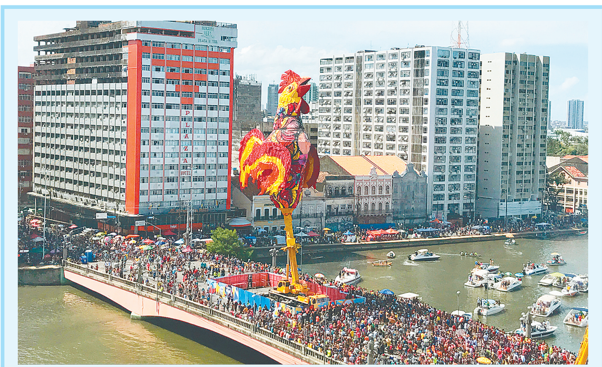
这是2月25日在巴西累西腓狂欢节上拍摄的巨型鸡模型。25日一早,民众穿着五颜六色的服装从四面八方聚集到巴西东北部城市累西腓的市中心,参加“拂晓鸡鸡”俱乐部的狂欢节巡游。俱乐部特别准备了中国龙花车,向中国鸡年致敬。

26日,福州国家森林公园中,两只绣眼停留在枝头。初春时节,福州市区各大公园鲜花次第开放,鸟儿在花间穿行嬉戏,吸引众人观赏。