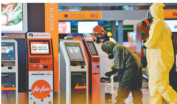
26日,在吉隆坡国际机场二号航站楼,专业人员进行有毒危险物质检测。马来西亚警方当日宣布,未发现有毒危险物质残留。

苏布拉马尼亚姆说,完整的尸检结果报告将交给警方处理,卫生部门的下一步是完成朝鲜男子身份的鉴定。他表示,最好的方式仍