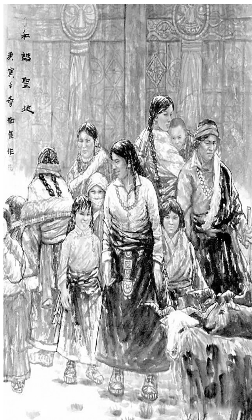
和谐圣地(国画) 蔡卫星

不要那么人是思想动物,你没有依据说明一块石头就没有思想。世界上万事万物都有自己的运行、生存法则,都具有科学无法阐明的灵性,保持沉默是最好的生存方式。没有一块石头不想成为玉,既然没能成为玉,我们就安静地做一块石头吧!