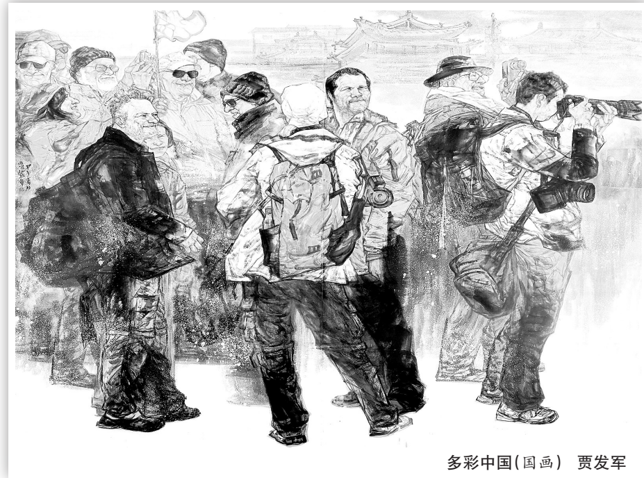
多彩中国(国画) 贾发军

我们站在紫色的薰衣草前,有很多蝴蝶飞来飞去。我想说一些劝慰的话,还没开口,她已经在拉着我的手,让我看那些蝴蝶,她说,姐,你看蝴蝶多美丽呀,它们不悲伤。