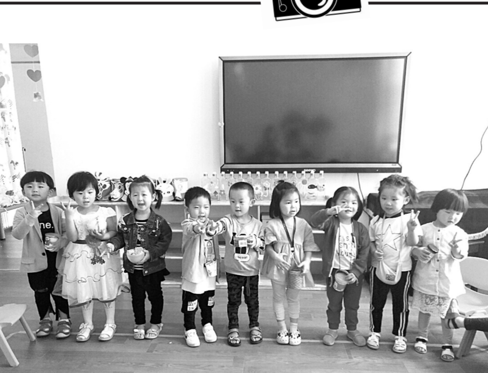
5月12日，郑州航空港经济综合实验区荷园幼儿园开展了“爱心护蛋，感恩母爱”的活动，让幼儿体验妈妈养育宝宝的辛苦，感受妈妈浓浓的爱。活动当天，每个孩子都用一个自制的“铠甲”小心翼翼地保护着自己的蛋宝宝。