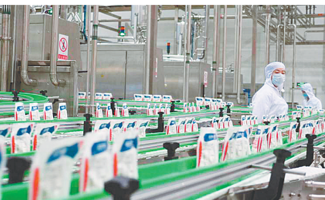
食品制造业现代化的生产车间

郑州市现有规模以上食品工业企业191家,2016年实现主营业务收入1025亿元,现代食品制造业为我市工业经济稳增长、保态势、促发展做出了重要贡献。