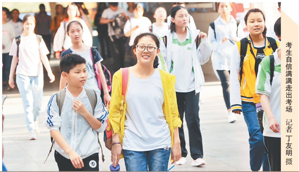
考生自信满满走出考场