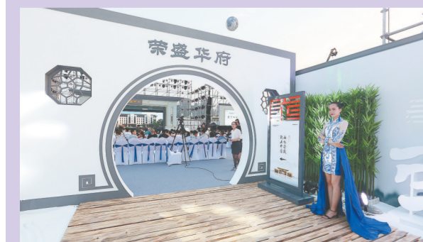
荣盛华府发布会现场入口处院子景观