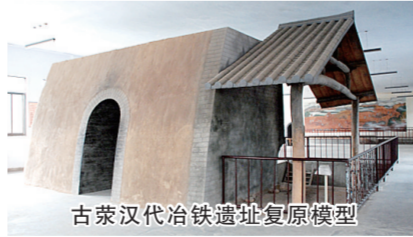
古荥汉代冶铁遗址复原模型