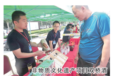
非物质文化遗产项目双桥酒

惠济桥是一座重要的古代拱形石桥，其丰富的传说和石桥同样具有历史价值、文学价值和人文旅游价值。现在这些民间传说和故事都被列入了非物质文化遗产保护名录。