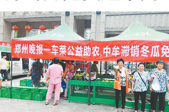
市民免费领爱心冬瓜

直通车将收购的8.5万斤冬瓜,免费发放给市民。为吸引更多市民前来领取冬瓜,在各个运营点社区,“郑州晚报一车菜”悬挂了“郑州晚报一车菜”公益助农,中牟滞销冬瓜免费送”的条幅,看到爱心助农的条幅,小区居民纷纷排起了队伍,领取免费冬瓜。