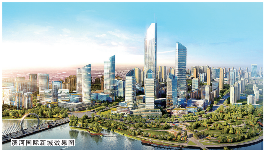
滨河国际新城效果图

产城互动融合产生的“化学反应”，在郑州经开区愈演愈烈。经开区“千亿级产业”以如椽之笔勾勒出郑州滨河国际新城新的发展画卷，郑州滨河国际新城高起点定位、高水平规划、高标准建设，未来也必将吸引更多的大项目、好项目落户郑州经开区，为支撑郑州国家中心建设发展大局作出更大贡献。