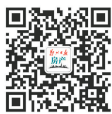
郑报房产微信公众号

在郑东新区的牵引之下，在郑州大踏步向东发展的大势之下，在郑汴融城的深入推进之下，绿博组团——一个新兴的宜居片区成了近年来不断被提及、被关注、被看好的热门区域。规划定位高、生态环境好、文创产业集聚是该区域的显著特色，一线品牌开发商也在此大施拳脚，高品质楼盘林立于此。