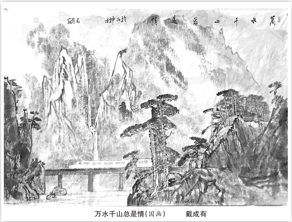
万水千山总是情(国画) 戴成有

该书为将鲁迅文学奖、人民文学奖、华语文学传媒大奖、庄重文文学奖等重要奖项几乎悉数囊括的70后著名作家乔叶的最新长篇小说。她以独特的结构和笔力从时间深处引来一泓活水,养成一个活色生香的虐心故事。爱与死、罪与罚等俱在其中,交织成锦,灼灼其华。显示出一种神奇灵动,秀丽酣畅的轻逸之美,而在轻逸中又隐藏着对尘世的深沉感悟和绵长叹息,令人耳目一新。