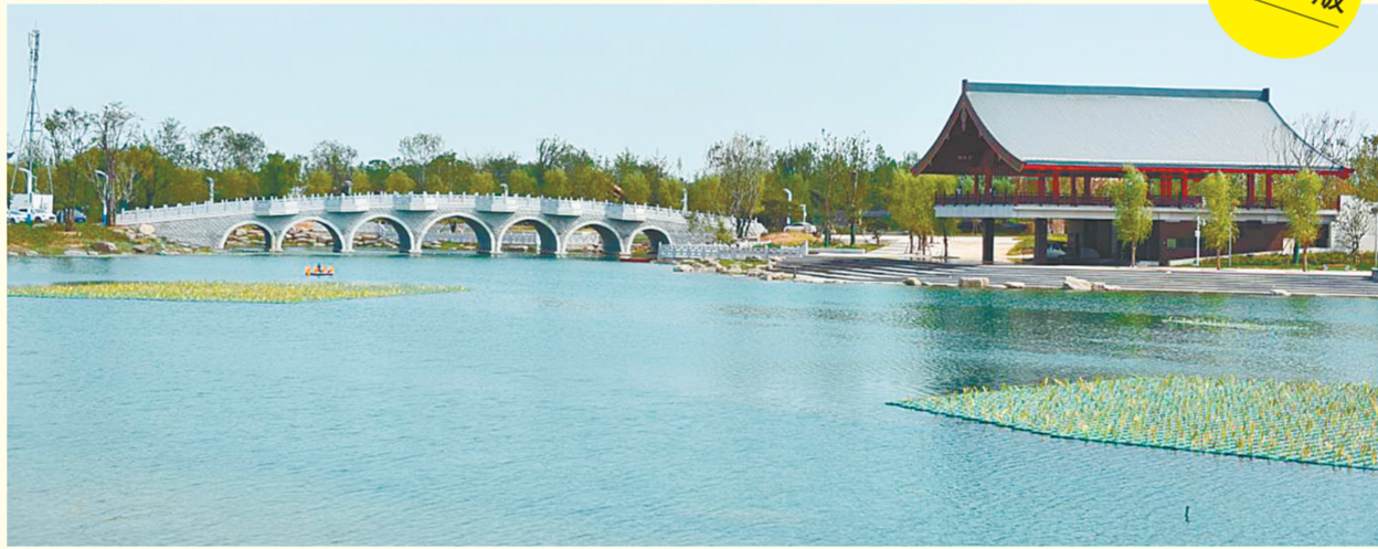
郑州园博园大部分城市展馆已竣工,个别展馆正加紧收尾。