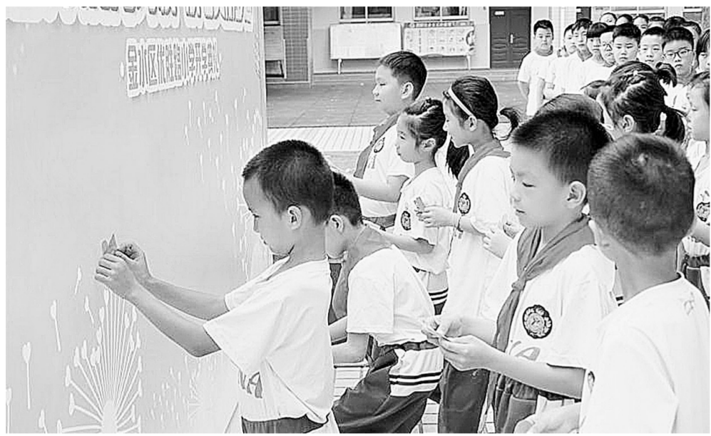
优胜路小学开学典礼上,孩子们把写上梦想的美丽信笺,粘贴在“梦想的天空”蓝图版上。

新学期开始了,丰富多彩的开学典礼让学生充满惊喜,更为师生带来满满正能量。我市不少学校早已将开学课程纳入学校的课程建设,并尝试把仪式性活动注入每个孩子的生命历程中,成为每个孩子珍贵记忆中的时光节点,真正通过学校教育让孩子成长为充盈智慧、胸怀宽广的有德有识之人。