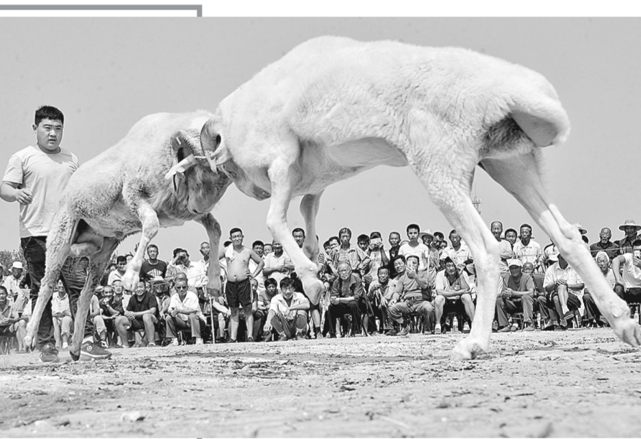
12日,山东省聊城市阳谷县李台镇第十六届斗羊大赛在四连村文化广场举行,来自该县及周边20多个县市的养殖户带着200余只羊参赛,吸引大批村民前来观看。