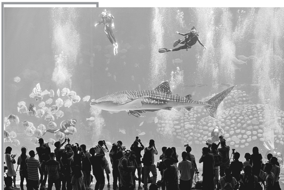
12日,潜水爱好者在珠海长隆海洋王国鲸鲨馆与鲸鲨同游。当日,10余位潜水爱好者成为首批体验“与鲸鲨同游”潜水项目的幸运儿。该项目每天开放20个体验名额,在潜水教练一对一陪护下进行体验。 新华社发