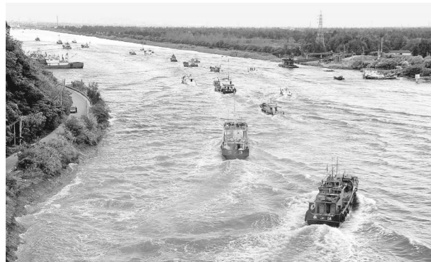
12日,渔船驶进浙江台州市金清大港避风。今年第18号台风“泰利”12日逐渐向我国沿海逼近。气象部门预计,“泰利”将给福建省造成较大风雨影响,该省已启动防台风三级应急响应。

国家版权局有关负责人说,2015年国家版权局组织开展规范网络音乐版权秩序专项整治以来,互联网音乐服务商标积极支持配合国家版权局相关工作,及时主动下线未经授权音乐作品220余万首,并共同签署了《网络音乐版权保护自律宣言》,网络音乐正版化已成为行业共识,网络音乐版权秩序基本好转。但当前网络音乐版权市场出现了一些问题,哄抬版权授权费用、抢夺独家版权、未经许可使用音乐作品等现象又有所反弹。这不利于音乐作品的广泛传播,不利于网络音乐产业的健康发展。国家版权局要求各互联网音乐服务商标积极维护网络音乐版权良好秩序,积极促进网络音乐广泛传播,推动网络音乐作品转授权,消除影响网络音乐广泛授权和传播的不合法、不合理障碍。