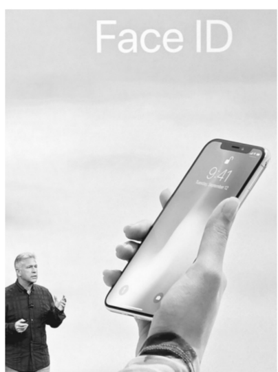
新款苹果手机iPhone X

于存在设计以及制造工艺上的难点导致成本大幅增加，比如听筒、前置摄像头的位置，以及如何解决正面指纹识别等都是要解决的问题，产品售价要比普通手机高不少。