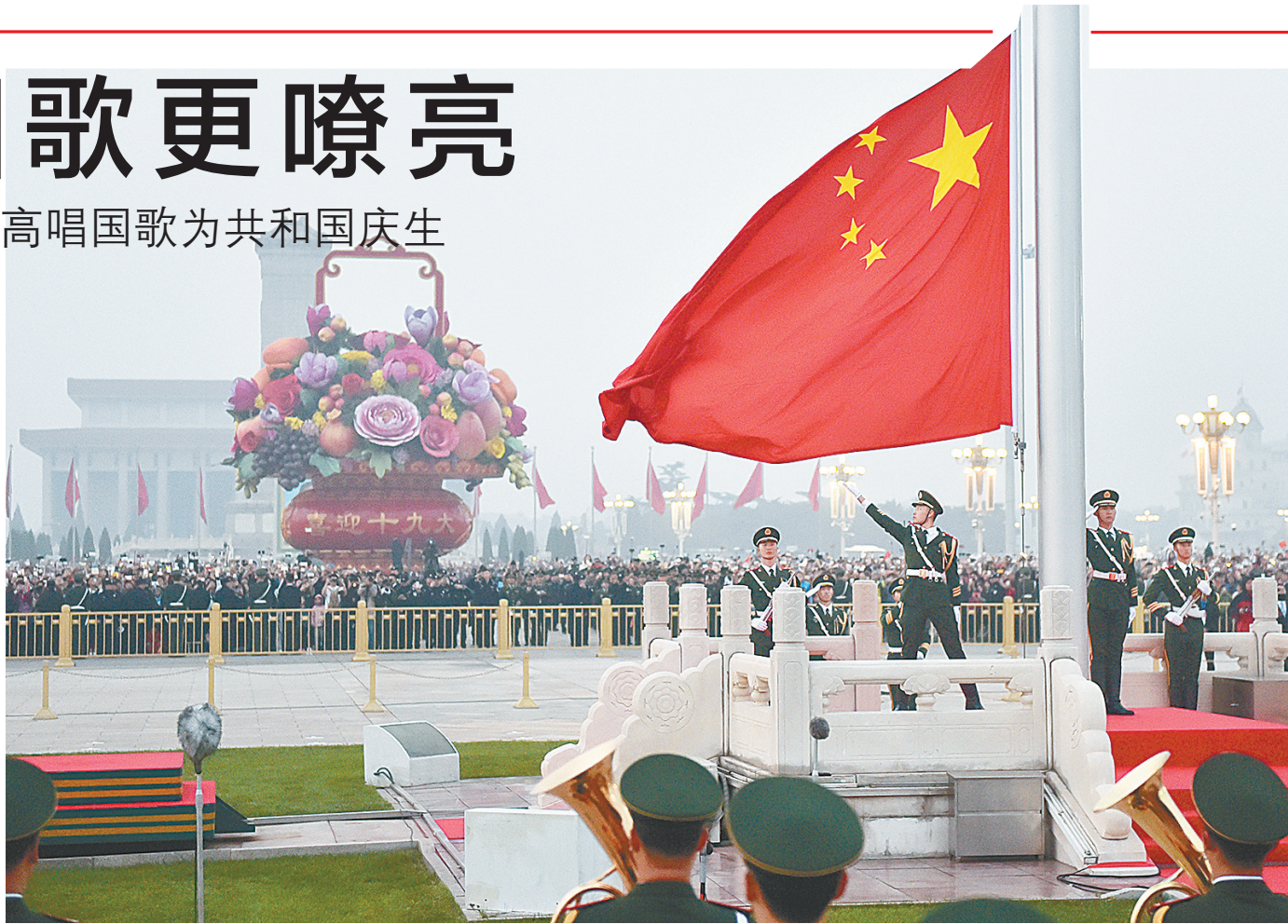
10月1日清晨,超过10万名来自全国各地的各族群众在北京天安门广场观看升旗仪式,庆祝中华人民共和国成立68周年。新华社记者 罗晓光 摄

据新华社北京10月1日电 10月1日是共和国68岁华诞,也是国歌法正式施行的首日。在雄伟的天安门广场,在祖国的边疆,全国各地群众高唱国歌,凝望迎风飘扬的五星红旗,举行丰富多彩的活动,为共和国庆生,祝福伟大祖国在民族复兴的征程上不断走向新的辉煌。 1日上午,来自全国各地的11.5万余名群众齐聚北京天安门广场,庆祝共和国68岁华诞。广场中央的“祝福祖国”大型“花果篮”果实累累,四周飘扬的红旗和各处装点的花篮营造出热烈的节日氛围。 清晨6时10分,雄壮的国歌声响起,五星红旗冉冉升起。万羽白鸽载着中华儿女对祖国的美好祝愿腾空起飞。仪式结束后,人们挥动着手中的国旗高喊“祝共和国生日快乐!” 来自吉林长春的陶岩曾在内蒙古自治区当兵,部队生活的历练让他懂得对国旗和国歌的尊重。他说,《国歌法》的实施让年轻一辈从国歌中找到信仰,更加热爱祖国。 国庆节当天,铁路上海虹桥站候车室里,一列“复兴号”模板吸引了旅客的注意。这是上海虹桥站制作的“复兴号”列车元素的镂空背景墙。时不时,就有举家出游的旅客前来与它合影。“看到‘复兴号’,就感到祖国现在是多么强大,中国高铁了不起!”旅客王先生说。 国庆节这天,刚通过河南省美丽乡村建设验收的辉县市张村乡裴寨村,洋溢着欢乐祥和的气氛中。 6时10分,雄壮的国歌声响起,五星红旗徐徐升起。乡亲们精神饱满,几位村民还调了调身姿,站得更挺直了。 升旗仪式结束后,村党支部书记裴春亮对大家说:“雄壮激昂的国歌,不断地提醒着我们,必须团结一心向着党,撸起袖子好好干,把我们的社区建设得更美好。”