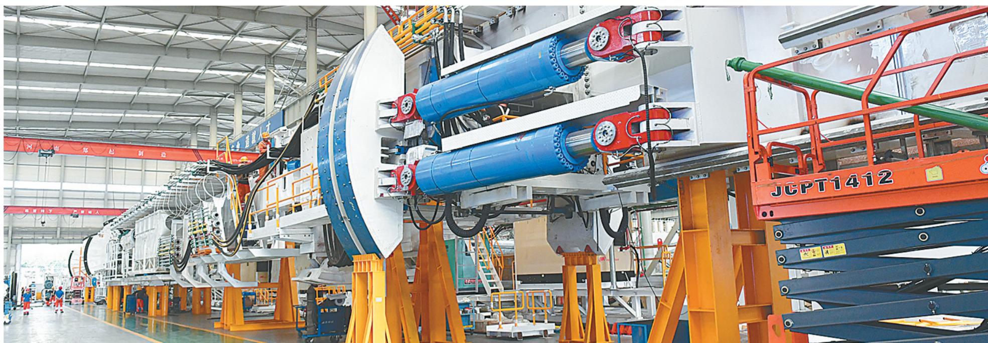
中铁装备生产车间

“中铁装备已成为国内最大、世界第二的隧道装备供应商,产品出口海外9个国家和地区,中国品牌在世界市场的影响力与日俱增。”中铁装备集团党委书记、董事长谭顺辉说,中铁装备设计制造的盾构机多次和世界顶尖企业的产品同台竞技,很多方面不分伯仲,部分技术处于领先地位。