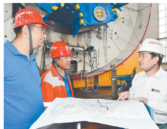
认真研讨论证产品设计方案