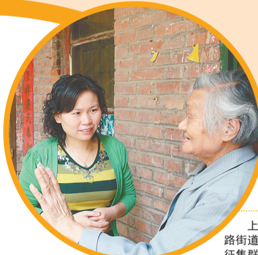
上街区新安路街道现场入户征集群众意见