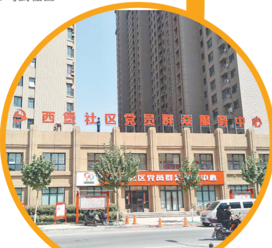
管城区紫荆山南路街道西堡社区外景