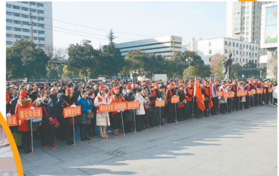
二七区党员志愿服务队