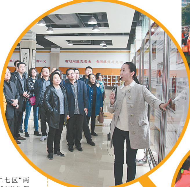
社区党组织书记到武汉百步亭社区学习交流

——建立工作落实和激励机制。工作推进上,制定了《二七区委全面从严治党重点任务分解》《二七区“两学一做”学习教育常态化制度化督导工作方案》等8个文件,建立了“大督察”工作机制和“智慧督查”系统,实时对党建重点工作,进行精准交办、自动预警、跟踪问效、督查落实;工作作风上,制定了《严肃工作纪律整顿干部作风的若干规定》《干部职工管理办法》等文件,强化作风建设和党员干部队伍管理,做到真管真严、敢管敢严、长管长严;工作保障上,创新建立干部能上能下、容错纠错等一系列保障