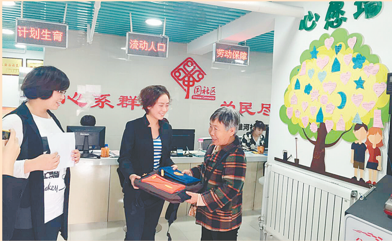
在职党员开展微心愿服务活动

“抓好党建是最大政绩,推动发展是第一要务。”二七区委书记陈红民介绍,近年来,二七区紧扣郑州市委新型城镇化、产业发展、开放创新、生态建设“四大重点”工作,维护社会大局稳定,强化党建保证的“四重点一稳定一保证”工作格局,以“创优势、增实力、补短板、能抓住”为总方针,以全面从严治党的为主线,按照“1136”的党建工作思路,把抓基层、打基础、强服务、惠民生、促发展作为长远之计和固本之举,围绕中心、服务大局,聚焦主业、夯实基础,大力实施“筑体系 强堡垒 争先锋”工程,推动了全区城市基层党建工作的全面进步、全面过硬,使全区主动融入郑州国家中心城市建设的步伐更加坚实、更加有力。