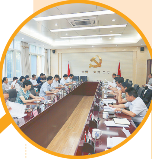
定期召开区委常委会研究部署党建工作

化建设项目台账》,对24个区直机关党组织名称进行了规范,对功能活动室、阵地场所等8个方面进行规范化建设。以“规范、提质、引领”为主题,扎实推进“非公党建试点引领计划”,全年新建党组织22个,打造了爱馨养老集团、路华大厦等19个具有二七品牌的非公和社会组织党建示范点,全区基层党组织得到进一步规范和提升。