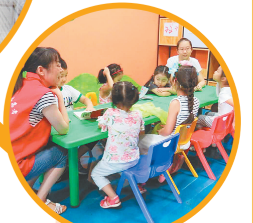
嵩山路街道党群服务中心馨家苑社工开展专业化服务