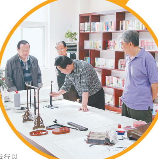
新建成的社区活动室

——基层党支部层面。通过打造1个党建系统,开发1张党员活动智能卡,重点研发党组织管理、党员管理、活动管理、堡垒积分、先锋积分、统计分析“六大功能模块”,搭建形成了“二七区基层党建标准化信息系统”,明确了“三会一课”、组织生活会等13项基层党建在线管理、实时督导,全面提升了党建的科学化、信息化和规范化水平。系统运行以来,全区各级党组织依托系统开展各类党内活动3677次,参与党员达17807人次。