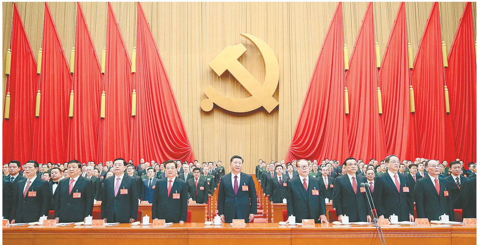
10月18日,中国共产党第十九次全国代表大会在北京人民大会堂开幕。这是习近平、李克强、张德江、俞正声、刘云山、王岐山、张高丽、江泽民、胡锦涛在主席台上。

新华社北京10月18日电 绘就伟大梦想新蓝图,开启伟大事业新时代。举世瞩目的中国共产党第十九次全国代表大会18日上午在人民大会堂开幕。