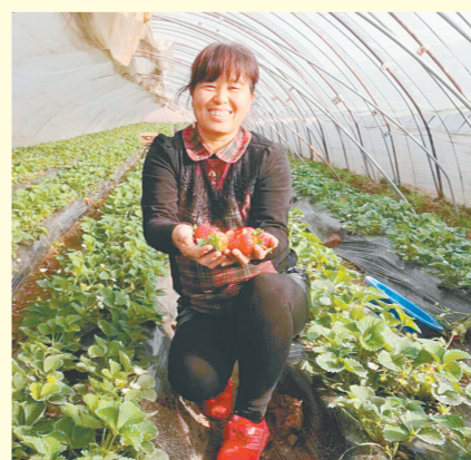
中牟县姚家镇西春岗村草莓种植助农民增收(资料图片)

记者来到郑州航空港区经济综合实验区空港跨境进口商品直购中心,从世航U选精品超市,再到瑞士名表店,又到跨境商品线下体验馆,全场商品琳琅满目,顾客络绎不绝。