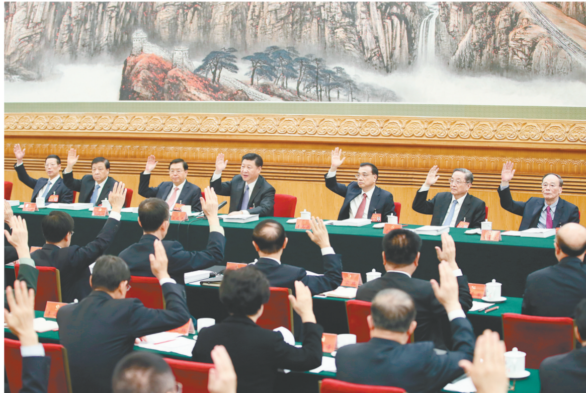
10月23日,中国共产党第十九次全国代表大会主席团在北京人民大会堂举行第四次会议。习近平、李克强、张德江、俞正声、刘云山、王岐山、张高丽等出席会议。