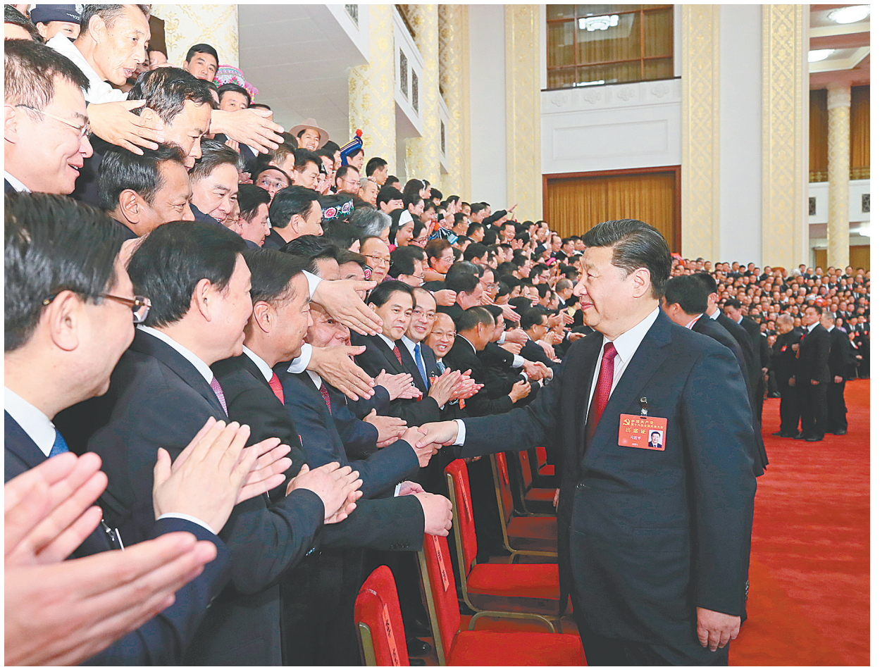
10月25日下午,中央领导同志在北京人民大会堂同出席党的十九大代表、特邀代表和列席人员合影留念。这是习近平同志与代表亲切交谈。

新华社北京10月25日电 中共中央总书记、国家主席、中央军委主席习近平25日下午在人民大会堂亲切会见了出席党的十九大代表、特邀代表和列席人员,并同大家合影留念。 李克强、张德江、俞正声、张高丽、栗战书、汪洋、王沪宁、赵乐际、韩正、丁薛祥、马凯、王晨、刘鹤、刘延东、许其亮、孙春兰、李希、李强、李建国、李鸿忠、李源潮、杨洁篪、杨晓渡、张又侠、陈希、陈全国、陈敏尔、范长龙、胡春华、郭声琨、黄坤明、蔡奇、江泽民、胡锦涛、李鹏、朱镕基、李瑞环、吴邦国、温家宝、贾庆林、宋平、李岚清、曾庆红、吴官正、李长春、贺国强、刘云山、王岐山、尤权、杨晶、杜青林、刘奇葆、张春贤、孟建柱、郭金龙、赵洪祝参加了会见。 人民大会堂宴会厅华灯璀璨,济济一堂,洋溢着热烈喜庆的气氛。2700多名代表、特邀代表和列席人员汇聚在这里,着装整齐,精神饱满,怀着激动的心情,等候领导同志到来。 下午4时,习近平等步入宴会厅,全场响起长时间热烈的掌声。