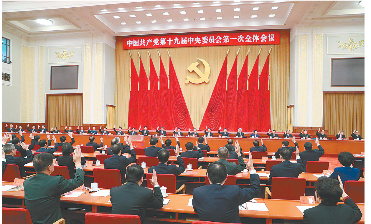
左图:10月25日,中国共产党第十九届中央委员会第一次全体会议在北京人民大会堂举行。习近平同志主持会议并作重要讲话。新华社记者 刘卫兵 摄