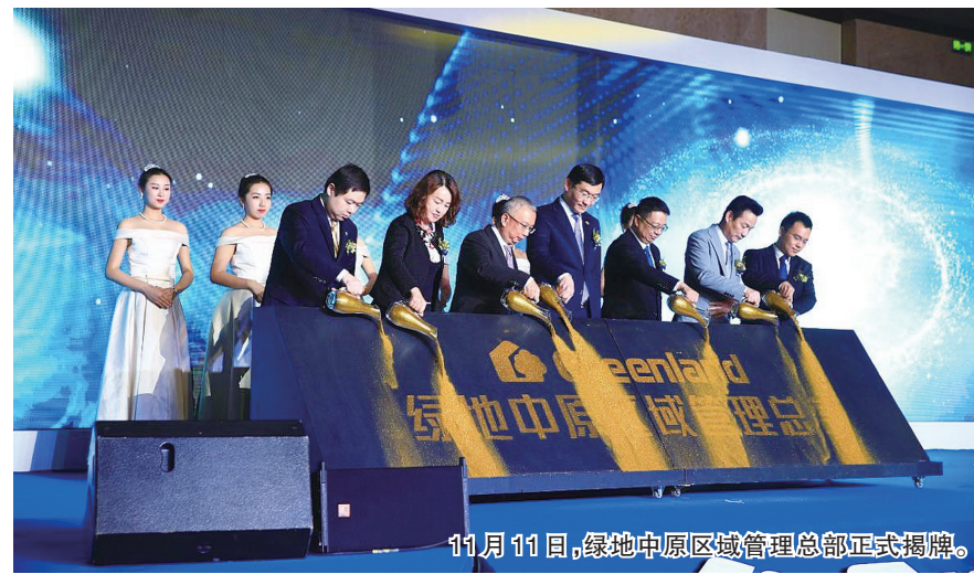
11月11日,绿地中原区域管理总部正式揭牌。

报频传,业绩连年攀高:2016年比2015年翻了一番,规模从500亿元到了1000亿元,2017年基建板块收入将继续大幅增长,有望实现2000亿元,预计到2020年实现4000亿元的年销售目标,成为国内颇具竞争力和影响力的投资建设集团之一。 绿地大基建不仅深耕国内,而且走出国门,积极投身“一带一路”建设。绿地旗下江苏省建集团最近签署了投资80亿元的“人民可负担房屋”项目合作协议,此举标志着蓄势待发的绿地大基建军团正式开启国际化发展征程。 郑州作为绿地大基建的重要阵地和战略高地,大基建成果令人瞩目。投资66.7亿元的河南垭沟高速公路项目,位于河南垭沟—山西垣曲,是河南、山西两省重要的省际通道之一,全长约63公里,包括3公里隧道。 2016年1月8日,绿地控股集团有限公司与郑州市人民政府签订《全面战略合作框架协议》。双方将以轨道交通项目建设、城市基础设