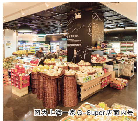
图为上海一家G-Super店面内景

而这只是世界500强、千亿房企绿地控股集团在大金融版块战略布局的一个缩影。作为绿地全资战略性金融投资平台和大金融战略实施主体,绿地金融控股集团充分发挥旗下投资的银行、证券、基金、信托等金融产业联动效应,立足于“国内+国外”“线上+线下”“投资+投行”的金融全产业链管理平台,布局股权投资、债权投资、资本管理及资本运作、新金融四大业务板块,目前下属17个业务主体。近三年来,绿地金融经营业绩喜人,净利润复合增长率高达244%,各类基金合同管理规模超过1200亿元。 除了经营业绩之外,绿地金融已在金融服务、医疗健康、文化娱乐、数字科技、物流电商、生态园林等领域,布局投资近20个核心项目,未来还将关注新型商旅、社区物业、智能家居等投资领域。 在11月11日的五大产业协同发布会上,绿地金融控股集团有关负责人表示:绿地金融将充分发挥“投资+投行”的金融平台优势,利用在资本运作和产业基金等方面积累的丰富经验,有效服务中原区域的实体经济,促进直接融资比重提高,助力中部地区崛起。与此同时,绿地金融还将设立千亿特色小镇开发基金和百亿特色小镇产业投资基金,助力中原区域国家级特色小镇建设。