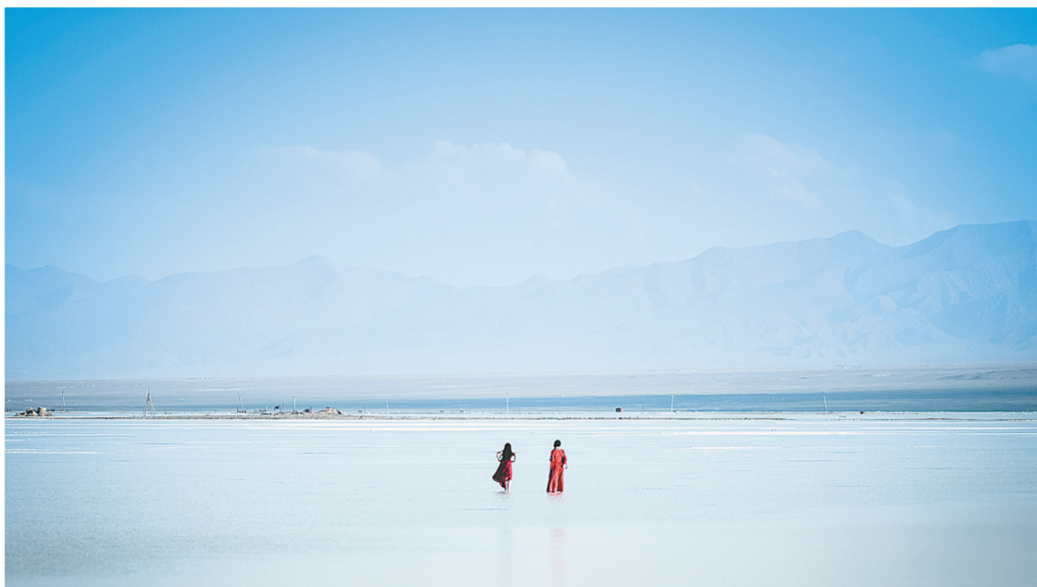
游客在茶卡盐湖游览。

中国航协有关负责人表示,能及时了解航班动态信息是每位旅客出行最为关注的事项,希望旅客购票时能够提供真实有效的联系方式,便于航空公司能够第一时间告知航班动态信息。