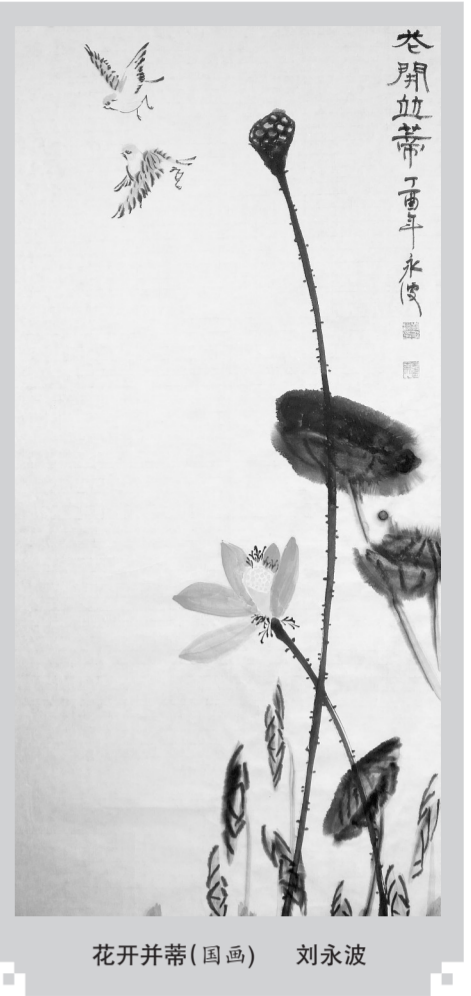
花开并蒂(国画) 刘永波