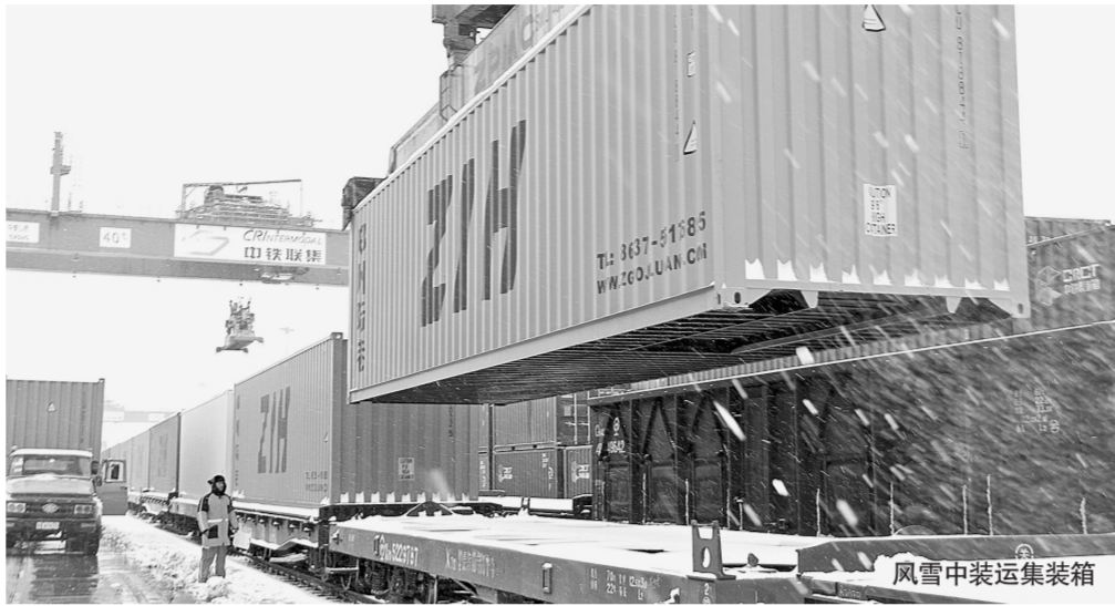
风雪中装运集装箱

另悉,为了确保今年第一趟郑欧班列顺利发车,作为郑欧班列发车点的郑州铁路集装箱中心站闻“雪”而动,及时启动“除雪打冰”应急预案,多措并举确保中心站生产作业安全及班列运输畅通。