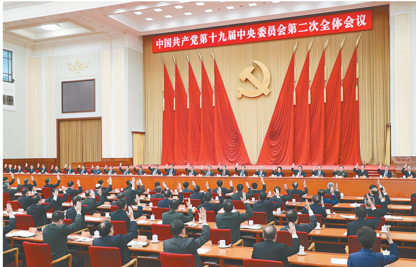
中国共产党第十九届中央委员会第二次全体会议,于2018年1月18日至19日在北京举行。中央政治局主持会议。