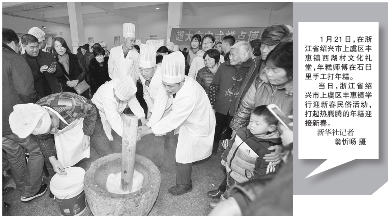
1月21日，在浙江省绍兴市上虞区丰惠镇西山村文化礼堂，年糕师傅在石臼里手工打年糕。当日，浙江省绍兴市上虞区丰惠镇举行迎新春民俗活动，打起热腾腾的年糕迎接新春。