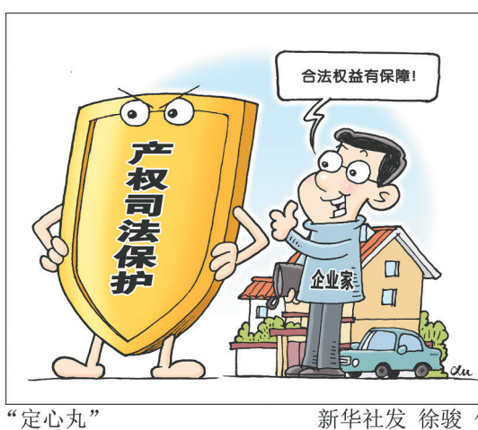
“定心丸” 新华社发 徐骏 作

新华社北京1月30日电(记者罗沙 陈菲)“一个案例胜过一打文件。”30日，最高人民法院发布7个人民法院充分发挥审判职能作用保护产权和企业家合法权益典型案例，最高人民法院发布4个检察机关办理涉产权刑事案件申诉典型案例。