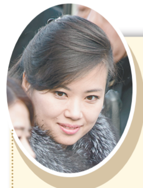
1月21日,在韩国江陵市,朝鲜三池渊管弦乐团团长玄松月对演出场地和音响设备进行检查。

香港特区行政长官林郑月娥6日上午表示,非常敬重饶宗颐,形容自己和对方关系密切,曾邀请饶宗颐和家人到礼宾府茶聚。