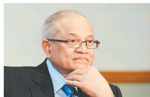
这是2008年10月29日,加尧姆在马尔代夫马累出席新闻发布会的资料照片。