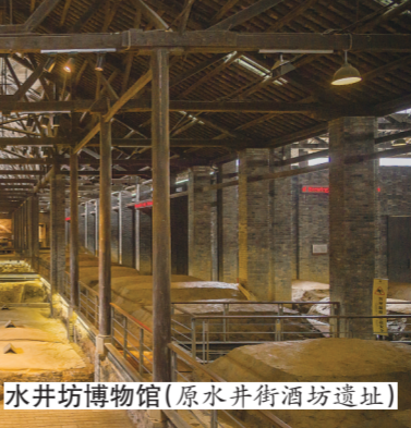
水井坊博物馆(原水井坊酒坊遗址)

代女考古学家的光荣与梦想;采用失蜡法工艺制造的青铜器云纹铜禁,为中国“智”造提供了技术支撑;见证了中华文明从蒙昧走向文明的贾湖骨笛,为我们研究中国音乐与乐器发展史,提供了弥足珍贵的实物资料。这三款国宝所展现出的文化新活力,让不少网友觉得中原一定能靠这三个“网红”级的国宝再次带动中华文化