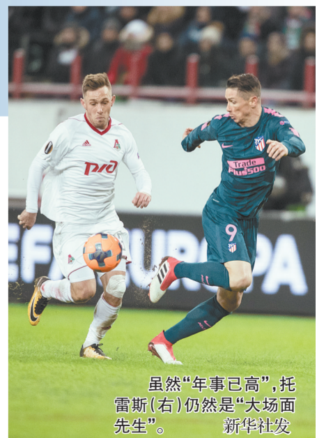
虽然“年事已高”,托雷斯(右)仍然是“大场面先生”。