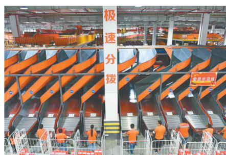
跨境电商多合一智能分拣设备

作为国家跨境贸易电子商务服务试点单位以及中国(郑州)跨境电子商务综试区核心区，位于郑州经开区的河南保税物流中心跨境电商业务量、进出口货值、纳税额、企业参与数量等各项指标在全国试点城市和跨境电商综试区中持续保持领先，成为全国跨境电商创新发展的“风向标”。目前，河南保税物流中心入驻备案企业达到1300多家，累计纳税约20亿元，提供就业岗位5万个，拉动投资近200亿元，进出口商品辐射全球185个国家和地区，一个全球网购商品的集疏分拨中心正在加速形成。