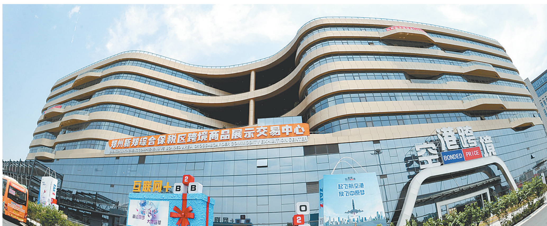
郑州综合保税区跨境商品展示交易中心

目前，郑州又全面启动了“EWTO核心功能集聚区”建设。一步领先、步步领先的郑州，将领航跨境电商迈进新时代。