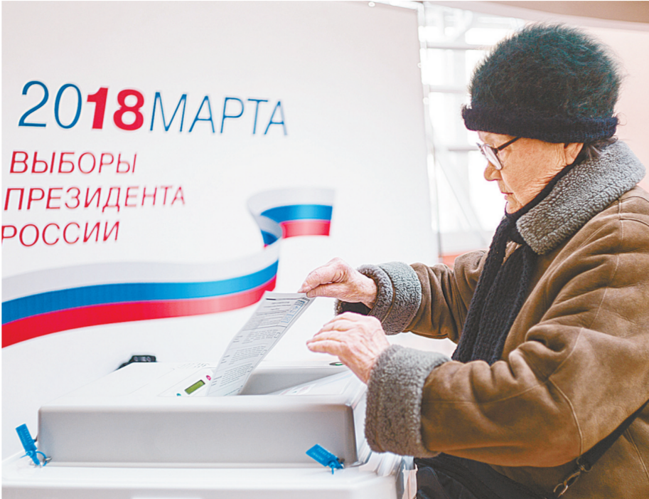
在俄罗斯首都莫斯科,一名选民参加投票