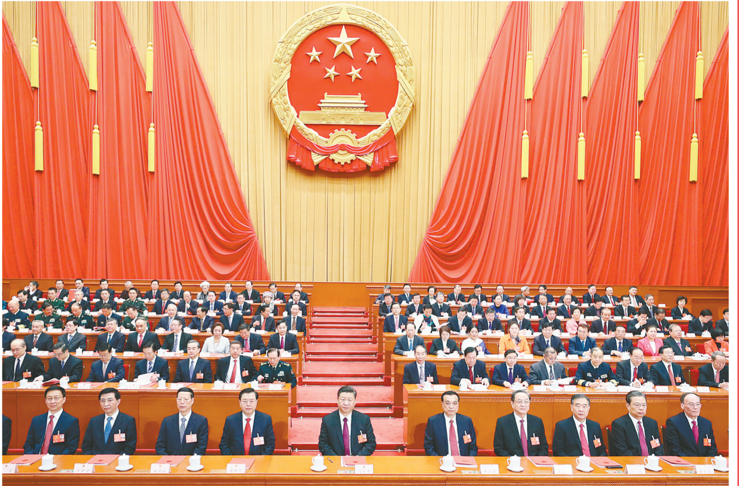
3月20日,十三届全国人民代表大会第一次会议在北京人民大会堂闭幕。习近平等党和国家领导人在主席台就座。

新华社北京3月20日电 中华人民共和国第十三届全国人民代表大会第一次会议,在圆满完成各项议程,产生新一届国家机构组成人员后,20日上午在人民大会堂闭幕。