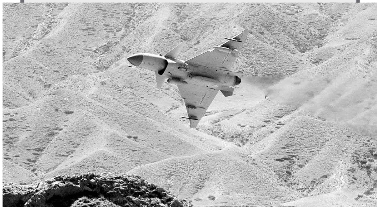
空军歼-10C战机进行飞行训练(资料照片)