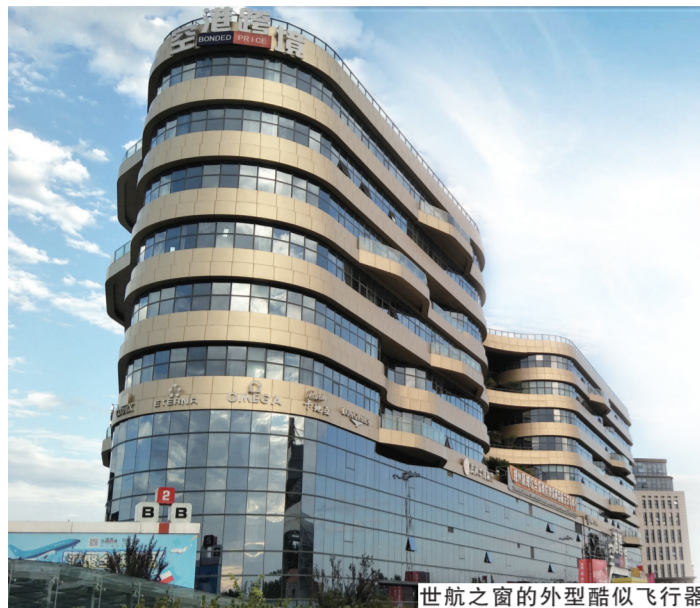
世航之窗的外型酷似飞行器