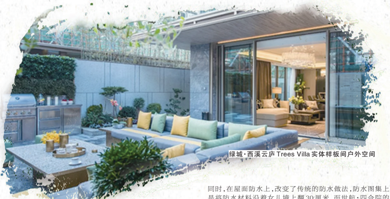
绿城·西溪云庐 Trees Villa 实体样板间户外空间

记者获悉，绿城管理的业务模式，缘起于2008年9月绿城创始人宋卫平提出的依托“绿城品牌和团队”实现业务创新的理念。2010年9月，绿城管理正式成立，标志着国内首家轻资产模式的房地产开发管理型公司诞生。2015年9月23日，绿城管理正式挂牌，成为绿城对外实施品牌输出和管理输出的主体，也是绿城轻资产模式从平台化走向集团化发展的里程碑。在投资与开发分离这一世界房地产主流发展模式的引导下，绿城管理将充分整合绿城23年开发经验与7年轻资产模式实践结晶，致力于发展成为中国后房地产时代全国第一的专业开发服务商，为委托方和资本市场提供房地产开发全产业链服务，以管理创造价值。“郑州航空港腾飞正其时，绿城管理在港区发展之后，今年首入航空港，与世航集团携手合作，联袂打造绿城·空港云庐，为港区的人居环境改善、为航空港的建设再添羽翼。”绿城·空港云庐项目有关负责人告诉记者。