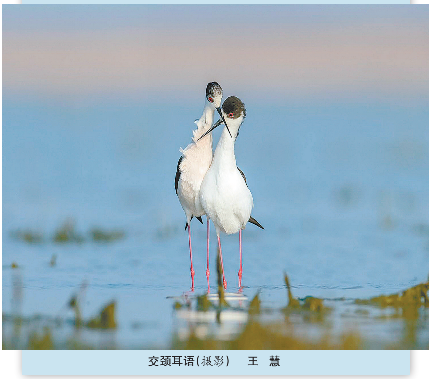
交颈耳语(摄影) 王慧

在乡间,农人们细数着一个个节气,踏着时令的节拍,播种希望,收获庄稼,喂养着一个个平淡的日子。谷雨节气也不例外,与农事息息相关。谷雨时节雨水增多,有利于谷类农作物的生长,民间农谚有“谷雨时节种谷天,南坡北洼忙种棉”“谷雨前后,种瓜点豆”等。谷雨前后,那些尘封的植物种子得以重见天日,经由农人粗糙的手掌心,播撒进泥土之中,随着一场激情喜雨的振臂高呼,渐次走向大地母亲的怀抱,孕育出崭新的生命和蓬勃的希望;再看那一地戴胜的麦苗,昂起了头,挺直了腰,潜滋暗长,扬花灌浆,焕发出谷雨时节喜人的绿色,盎然的春意。